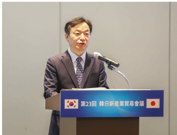
정대진 산업통상자원부 통상차관보