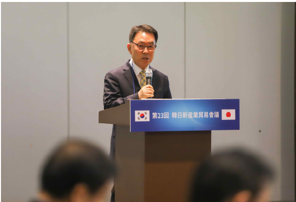
이창우 국회FTA일자리센터장 / 월드FTA포럼 회장