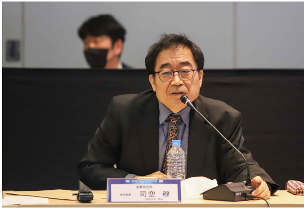
사공목 산업연구원 연구위원