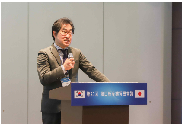
천경파 WISE FOREST(주) 대표이사